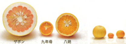
母はザボン、父は九年母