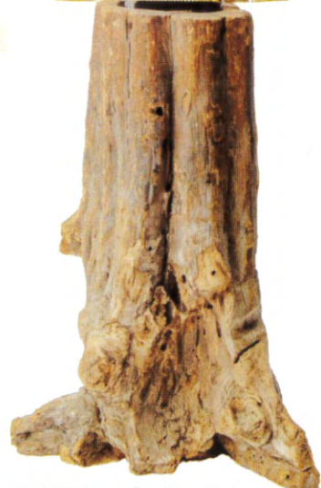
「八朔地蔵尊」と「八朔の原木」